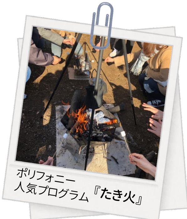
ポリフォニー 人気プログラム『たき火』