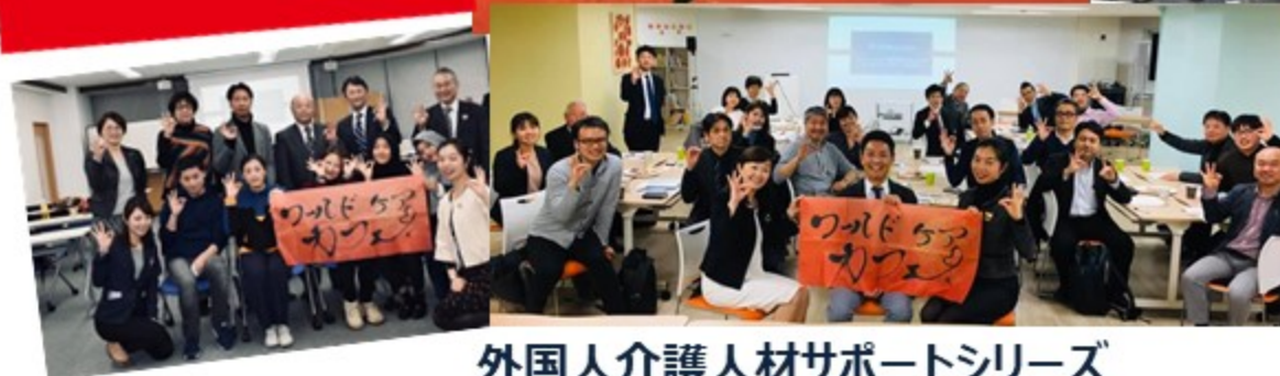
外国人介護人材サポートシリーズ